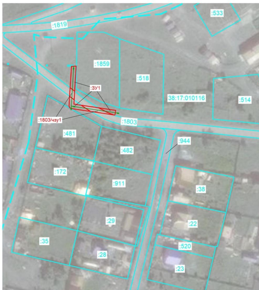
Схема границ публичного сервитута на кадастровом плане территории